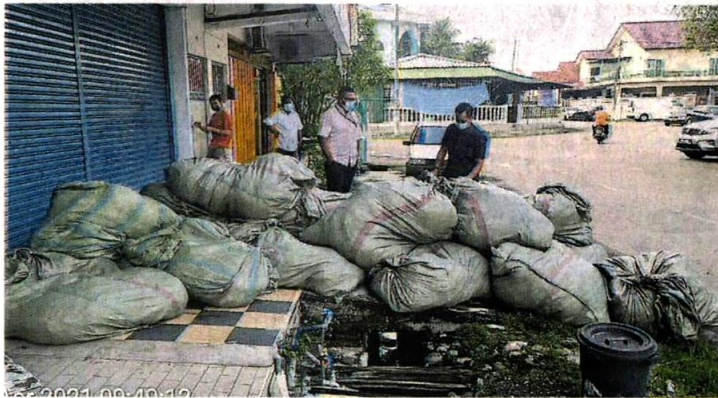
■经市议会及环境局检查后，证实店铺前堆积的垃圾皆为医疗废料。