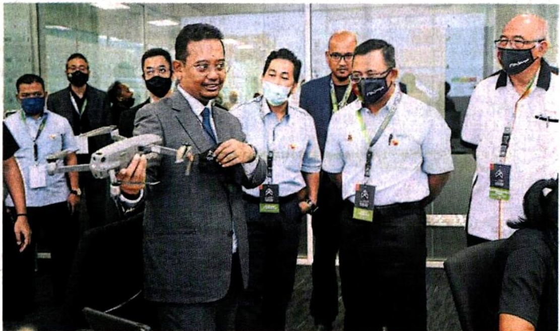
■阿米鲁丁 (右2) 在出席谅解备忘录的签署活动后，聆听有关无人机技术的汇报。

他也希望随著雪兰莪技能发展中心设立卓越中心 (COE)，将能成为无人机在大马的首创，也开启航空业在大马未来的发展。