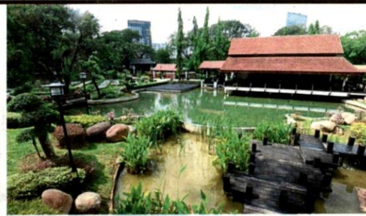
The Selangor Japan Friendship Garden in Shah Alam spans 2.42ha.