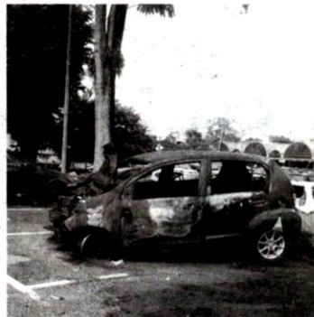
ANTARA kenderaan lupus yang tersadai di tempat letak kereta berbayar di Seksyen 8, Petaling Jaya, Selangor.