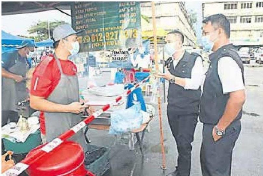
■执法人员将在各种市集上进行突击检查，揪出违反SOP者。